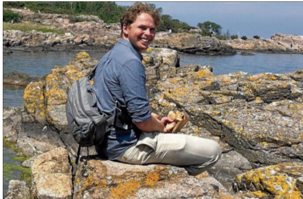
Forskning har igen og igen indikeret at tætte sociale bånd og interaktion med vores medmennesker er afgørende for vores mentale helbred, skriver Noah James Donkin i sin klumme om optimisme.

Selvom jeg først netop er hjemvendt til min fødeby, oplever jeg allerede nu den varme og fællesskab, som kun små byer kan byde på. I små byer som Helsingør er personlige forbindelser ikke noget, der opstår som en til-