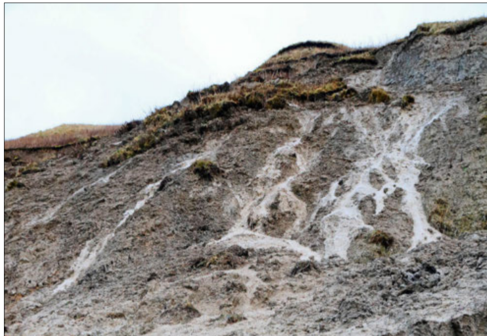
Politikerne fik set hvordan havet æder af skrænterne på nordkysten.

- Så længe der ikke er et tilsagn om penge, er det svært at tro på, siger Bent Hansen.