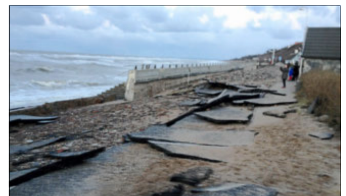
Sådan så Rågeleje Strandvej ud efter besøget fra Bodil for 10 år siden.