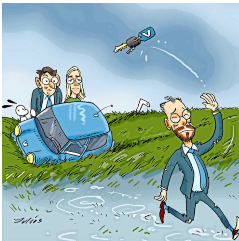
Jakob Ellemann trækker sig helt ud af politik.