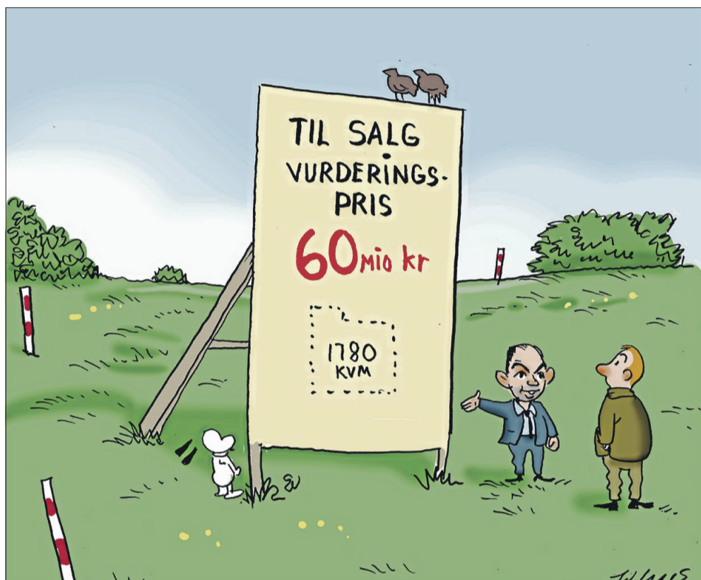
De nye ejendomsvurderinger stikker helt af.

Nedturen i meningsmålinger er stoppet. Det er positivt, men det må undre, at De Konservative ikke har profiteret af, at både Venstre og Moderaterne er gået tilbage, siden begge partier gik med i SVM-regeringen. Pape kommer nok gennem weekenden, men partiet har brug for at genfinde sin egen styrke. Uret tikker for både parti og Pape. HØJ