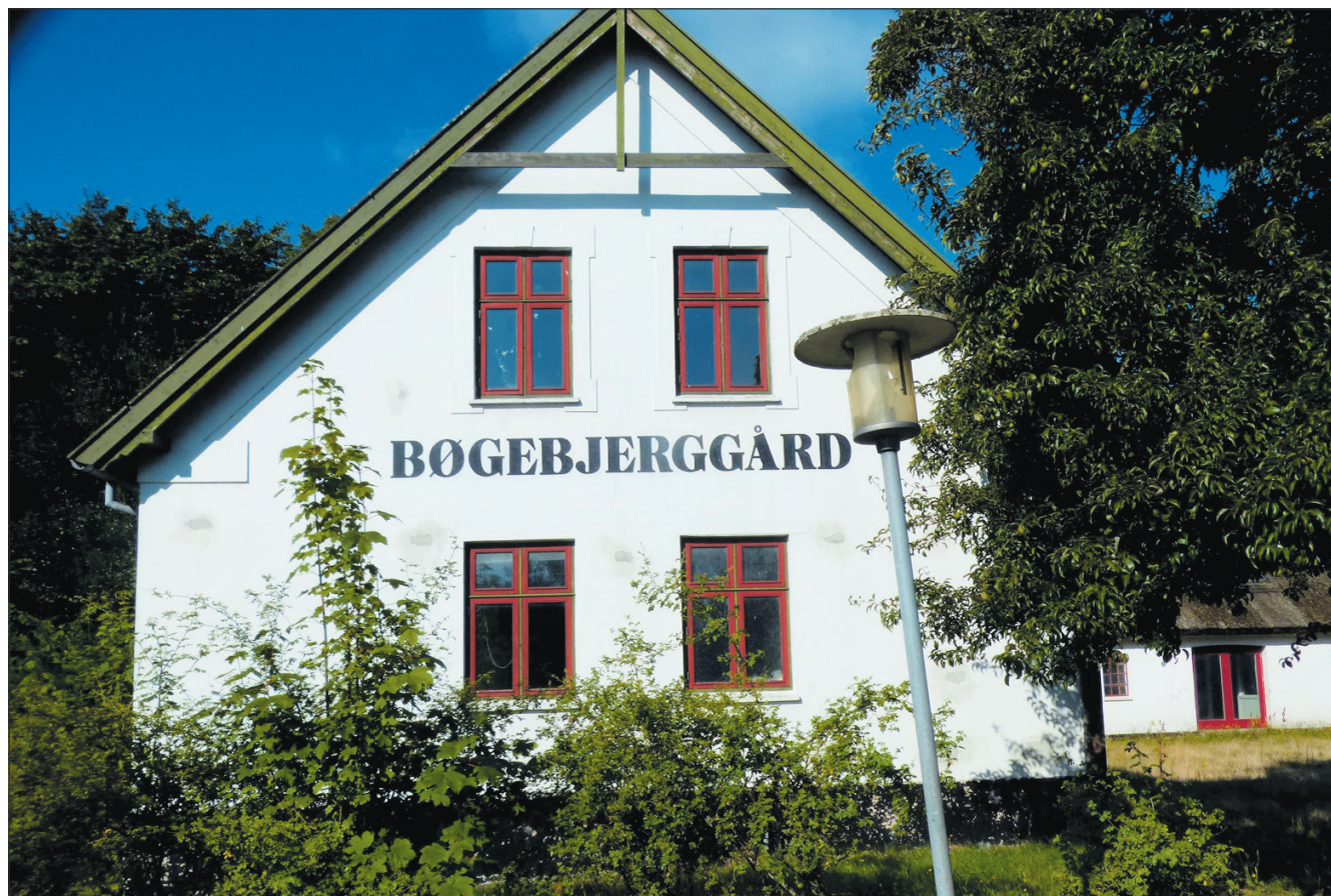
Bøgebjerggård er blevet bygget om, så ukrainske flygtninge kan indkvarteres på stedet. De første flyttede ind i juni.

- Den ene bygning er taget i brug, og den anden forventer vi bliver færdig inden 1. september. Pt. bor der 17 personer, heraf otte nyankomne, så