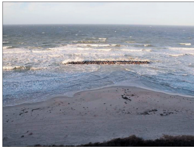
Fra Hyllingbjerg før og under stormen Bodil, 1. dec. og 6 dec. 2013, kl. 13.

De seneste år og i FAA d. 28/8 er der personer, som argumenterer for, at sandfodring kan erstattes af anlæg af undersøiske stenrev ud for kysten, og at disse skulle have