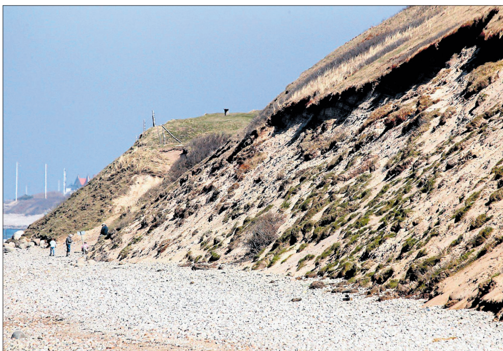
Borgmestrene skal nu til møde med miljøministeren i håb om at få hjælp til kystsikringsprojektet Nordkystens Fremtid. Billedet her er fra Vejby Strand.